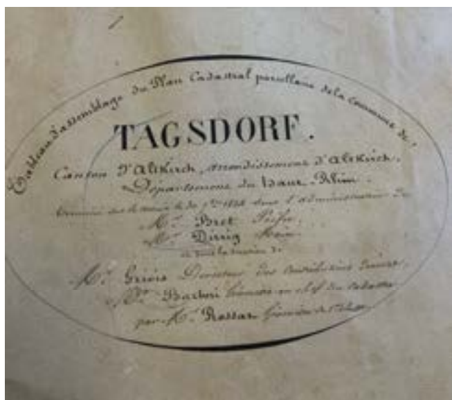
Le 1 er cadastre de la Commune de TAGSDORF, dit cadastre napoléonien date de 1834. Il est archivé en mairie.

En 2023, la Commune a adressé trois séries de demandes pour ses propriétés : parcelles, rues et chemins, fossés. Le 15 juin à raison de 22 mises à jour diverses ; le 10 juillet à raison de 6 mises à jour, pour les longueurs des rues et chemins ruraux ; le 20 septembre pour 15 modifications diverses. Ces demandes ont été prises en compte par le Service du Cadastre avec effet au 31 décembre 2023.