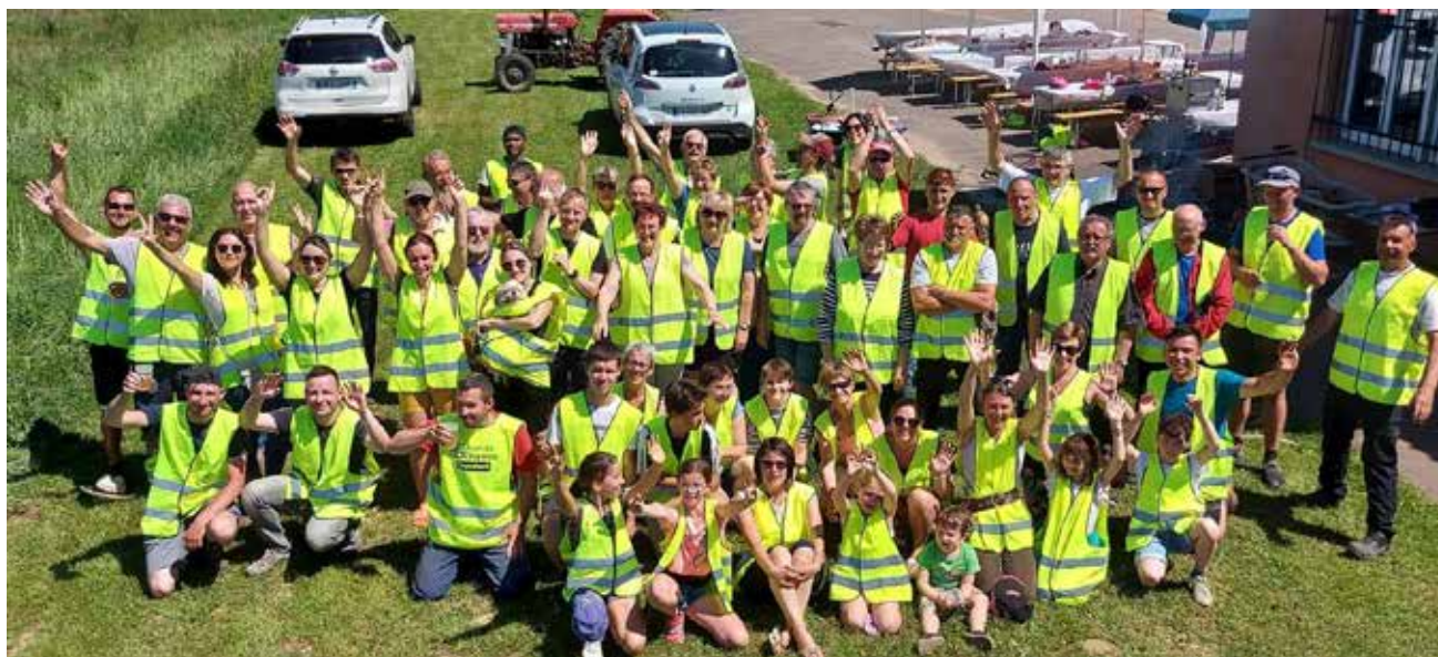
Des participants enthousiastes à la 1 re journée citoyenne de Tagsdorf

Au vu de son succès, avec la participation de plus de 60 habitants sur les 300 du village, le conseil municipal a décidé de reconduire la Journée Citoyenne. Elle aura lieu le samedi 13 mai 2023. Participez nombreux !