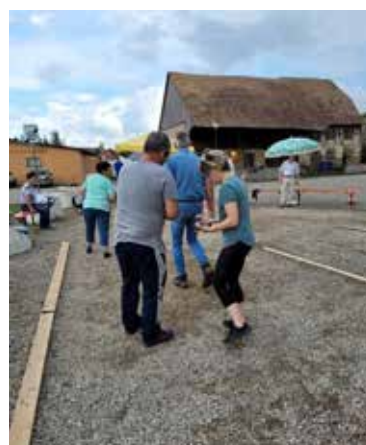
Initiation à la pétanque