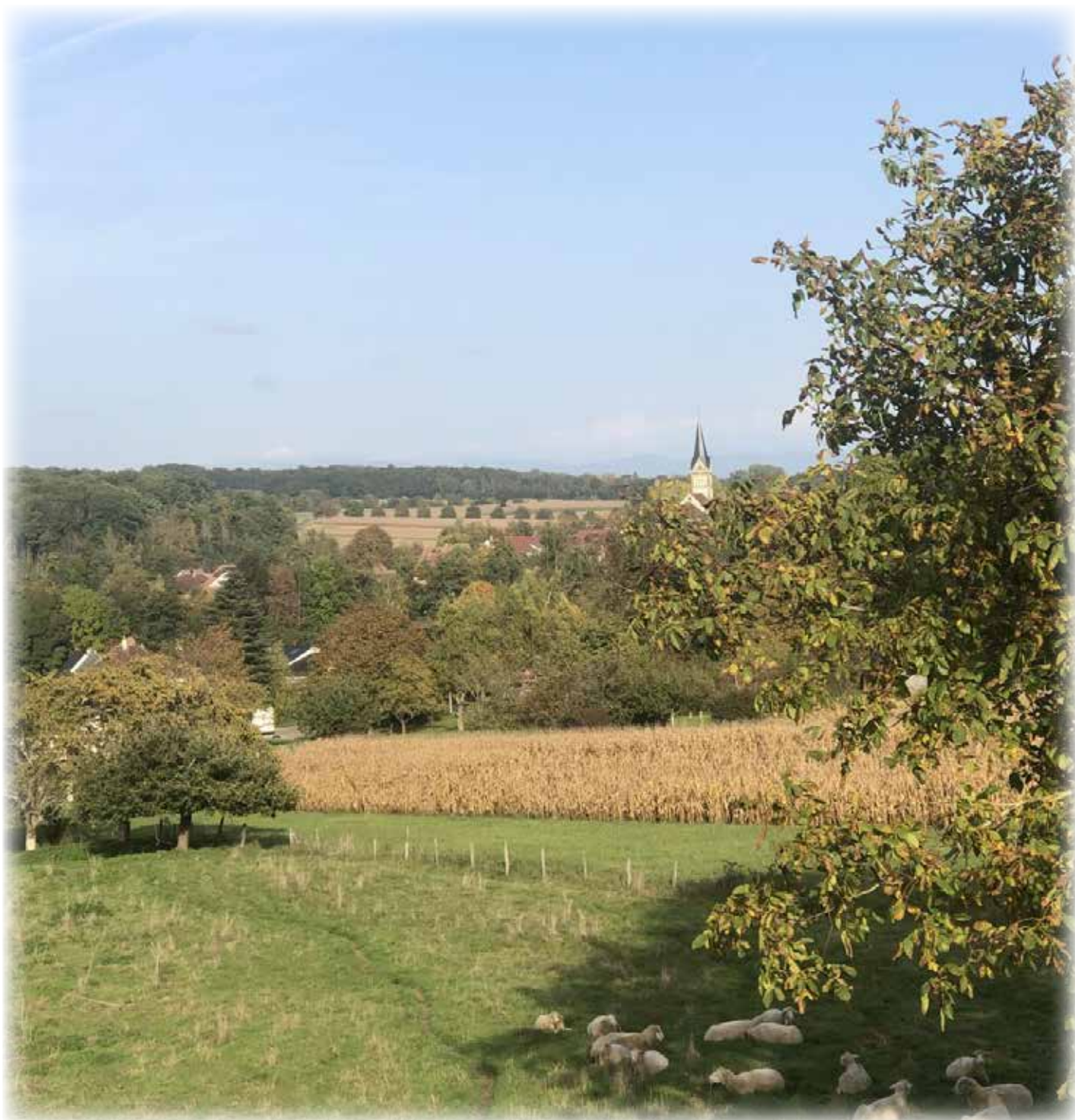
Vue sur le village du haut de la retenue des eaux d'orage chemin de Hirsingue