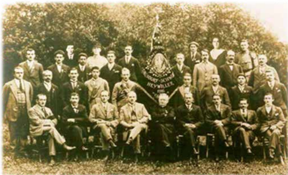
Les chantres lors de la bénédiction du drapeau le 9 mai 1926