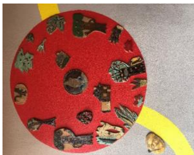
Détail de la fresque en céramique d'Anne Zimmermann sous le préau de l'école de Tagsdorf

Dans le périscolaire d'Emlingen, le nombre d'inscrits est passé de 77 à 100.