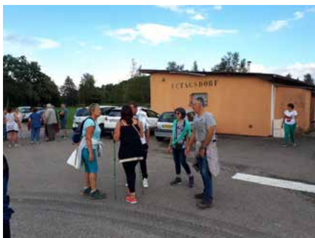
Rassemblement du groupe des marcheurs