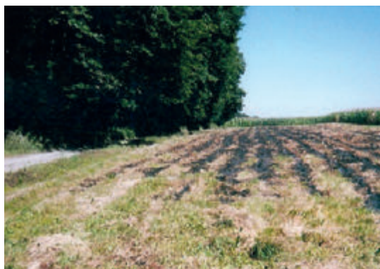
Brûlage de végétaux sur pied : «Ecobuage»