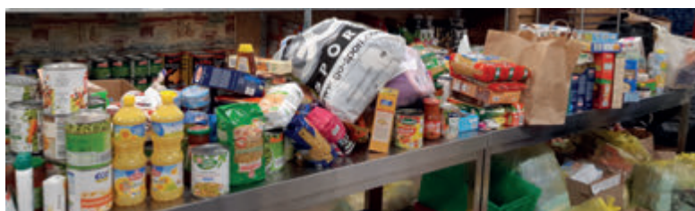
Une partie de la collecte des 4 écoles