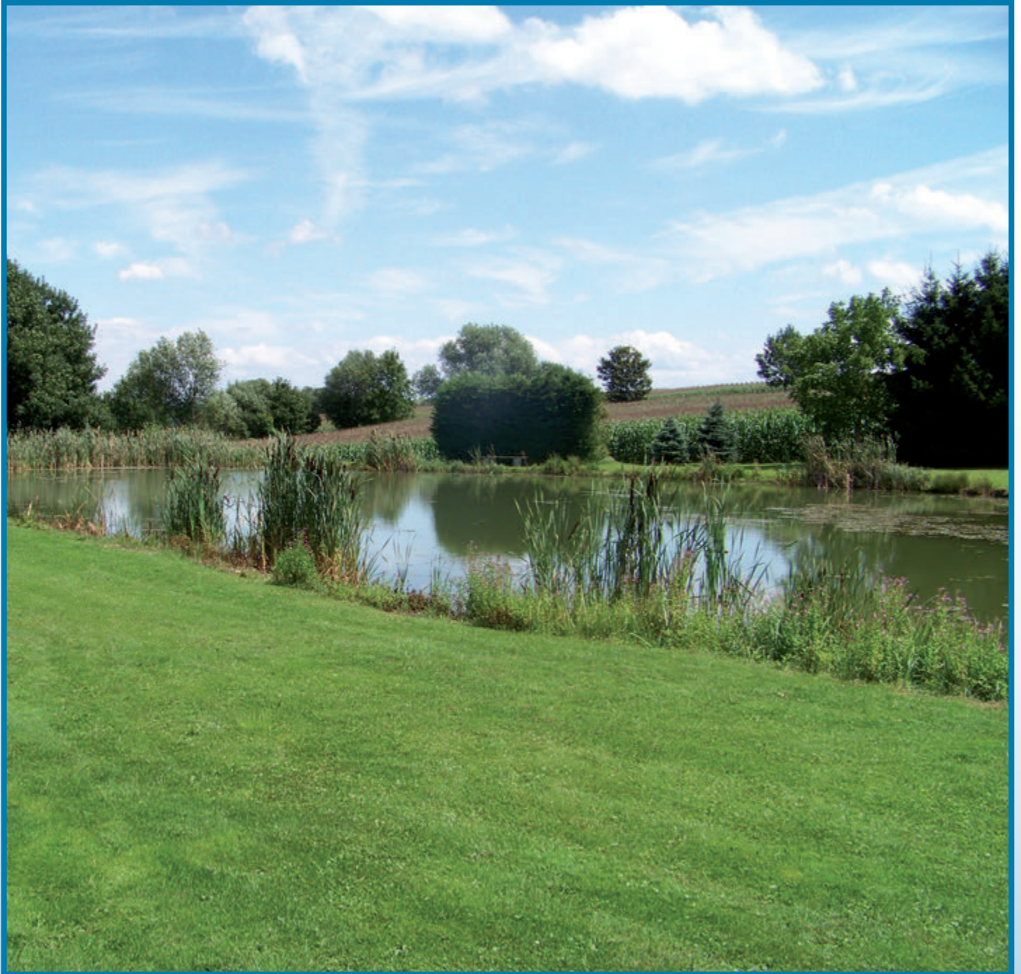
Étang de l'Association de Pêche et de Pisciculture chemin de Hirsingue