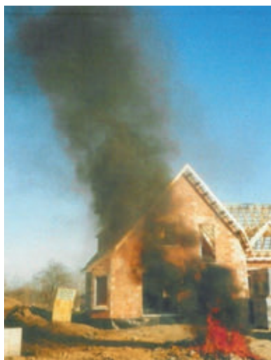
Brûlage de matières plastiques propre à polluer l'atmosphère