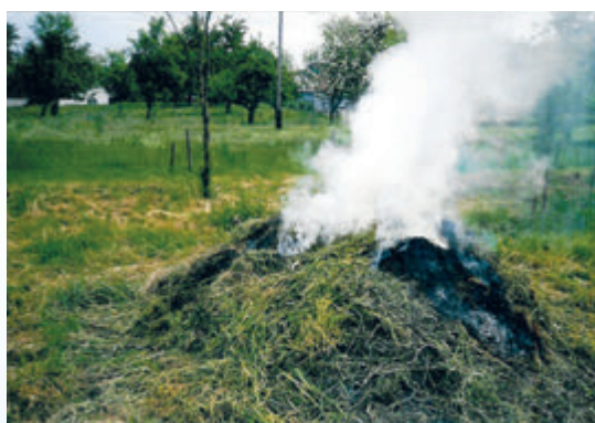
Brûlage de végétaux encore verts produisant une importante fumée propre à nuire à la tranquillité du voisinage

4/ la production de fumée propre à nuire à la tranquillité du voisinage (3 e classe)